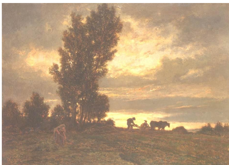
Théodore Rousseau O Campo